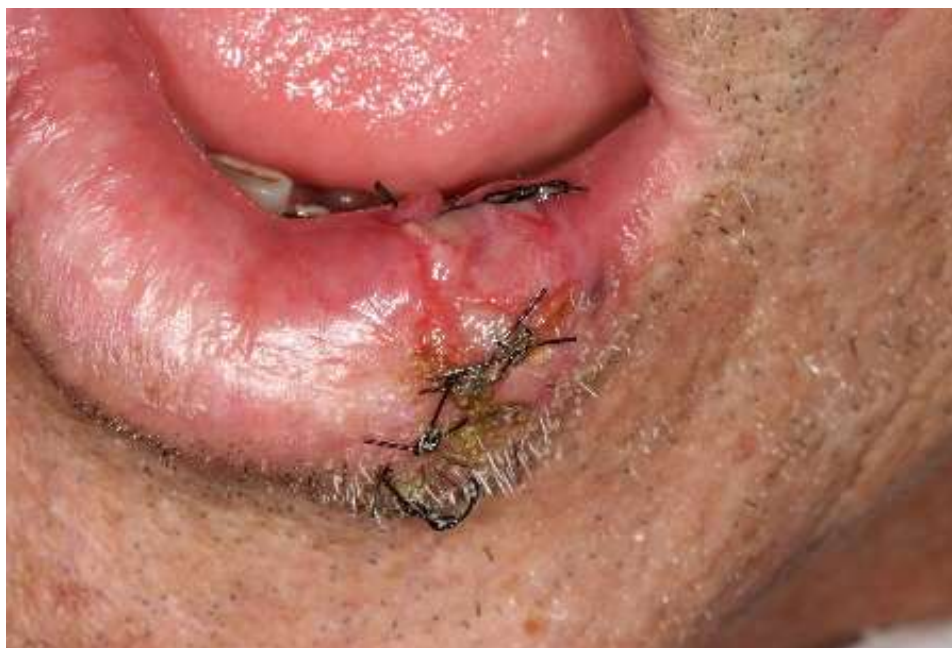
Figura 3: 2º controle para remover os pontos após 7 dias.