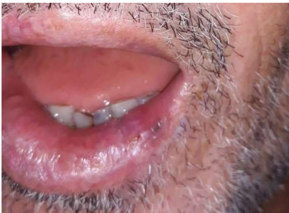
Figura 4: Aspecto final, após 15 dias da cirurgia.