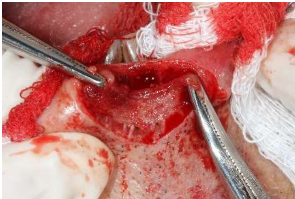
Figura 8: Hemostasia