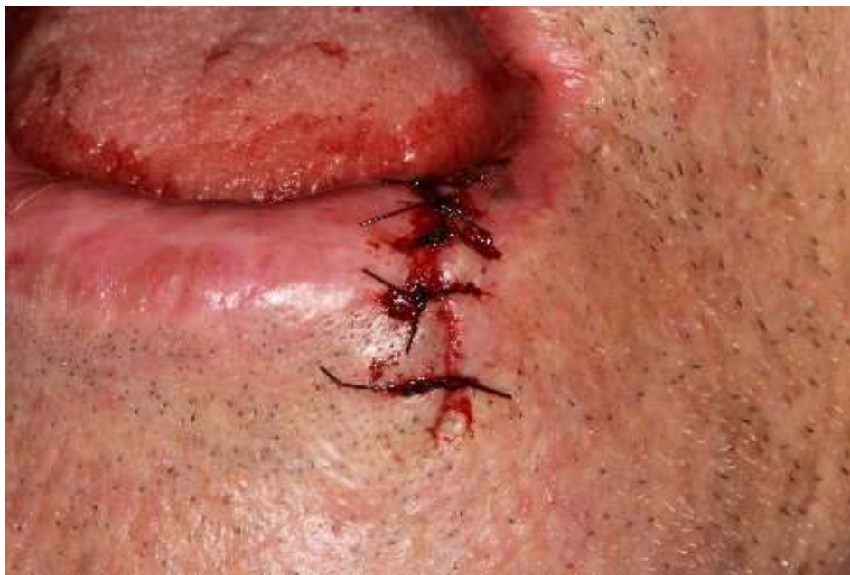
Figura 10: Pós imediato e sutura simples nylon 4.0.