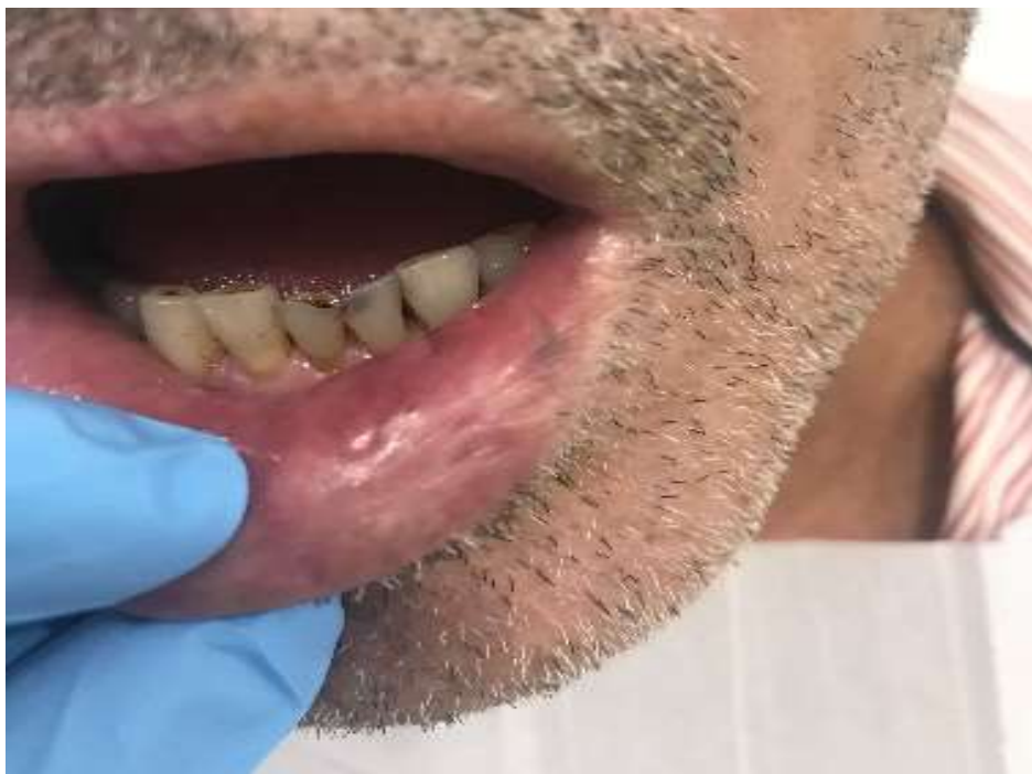
Figura 14: Aspecto final, após 22 dias da cirurgia