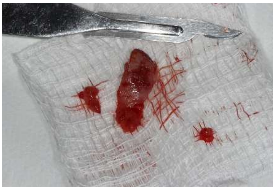
Figura 2: Lesão após retirada