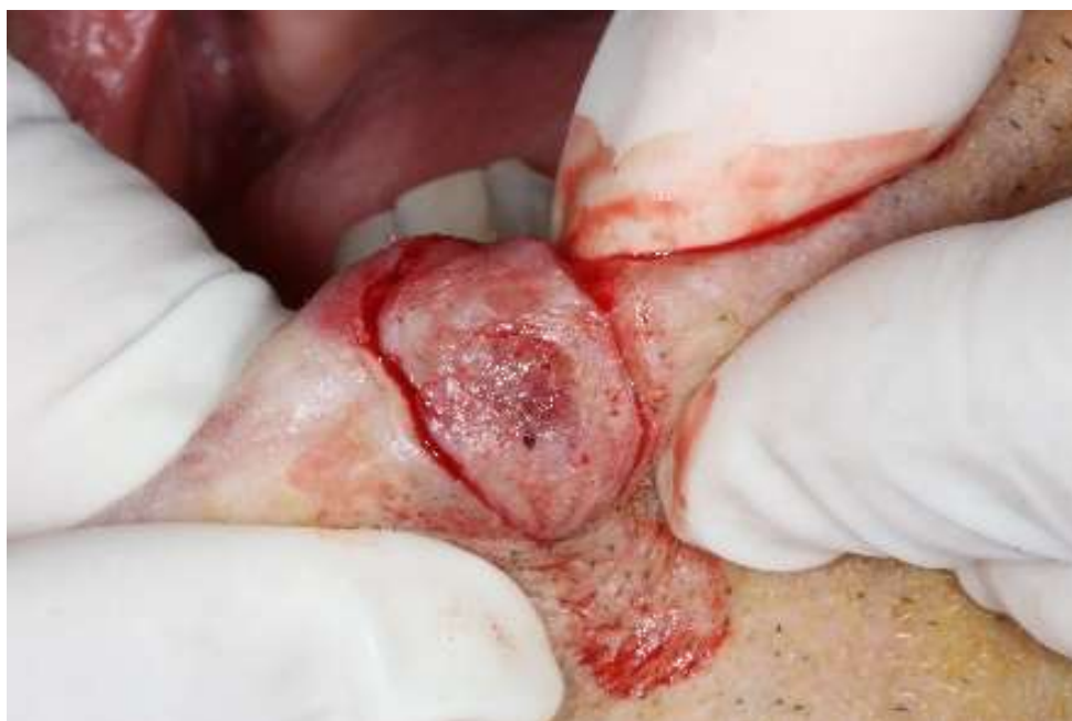
Figura 3: Demarcação da lesão.