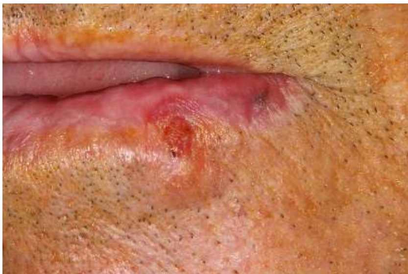
Figura 1: Aspecto inicial da lesão.