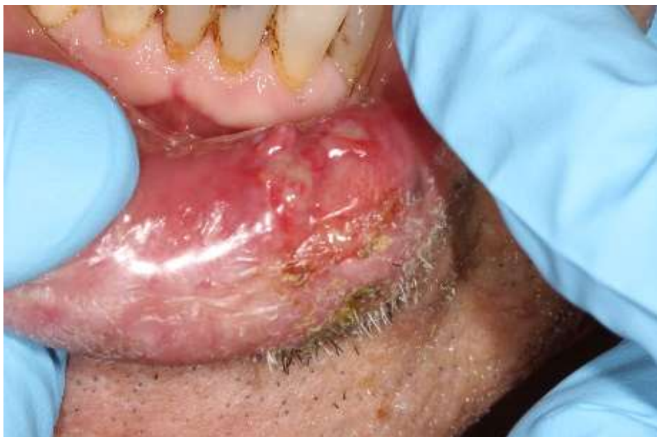
Figura 12: Remoção da sutura,