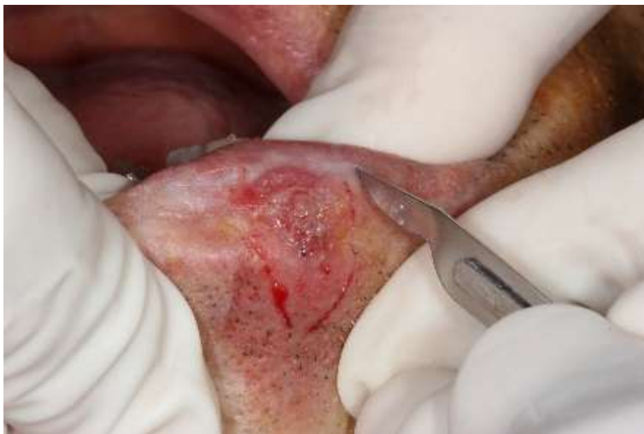
Figura 2: Demarcação da margem de segurança.