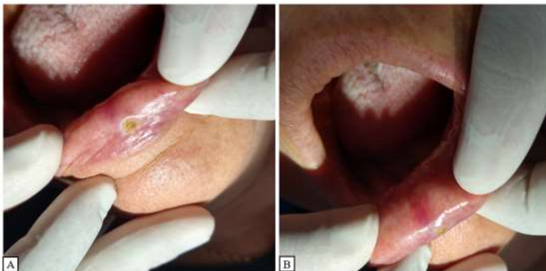
Figura 2: A - Observa-se lesão com superfície crostosa e de cor amarelada em lábio inferior. B – Região eritematosa em mucosa do lábio inferior.

Como hipóteses de diagnóstico clínico prévio, queilite actínica (QA) e carcinoma epidermóide (CE) foram as lesões sugeridas, baseadas nas características clínicas observadas e na história da doença. Após a realização do tratamento da lesão fúngica em língua e a observação de sua regressão, foi agendado o procedimento de biópsia da lesão em lábio inferior. Desse modo, como forma de compilar os dados clínicos, resultado histopatológico e, portanto, diagnóstico final, a paciente então foi submetida a biópsia incisiva, em razão de ser uma lesão com suspeita de malignidade.