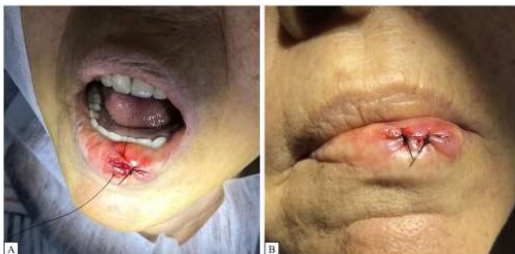
Figura 4: A – Realizando sutura simples. B - Sutura finalizada.

Após a remoção do fragmento, o mesmo foi manipulado com pinça Diedrich e acondicionado imediatamente em um recipiente com tamanho adequado ao tecido biopsiado contendo formol tamponado a 10% e enviado ao Laboratório de Patologia da faculdade São Leopoldo Mandic, na cidade de Campinas/SP. Como forma de reposicionar os tecidos e promover a cicatrização da região biopsiada, foi realizada sutura com 2 pontos simples, utilizando fio de nylon 5-0 (Figura 4).