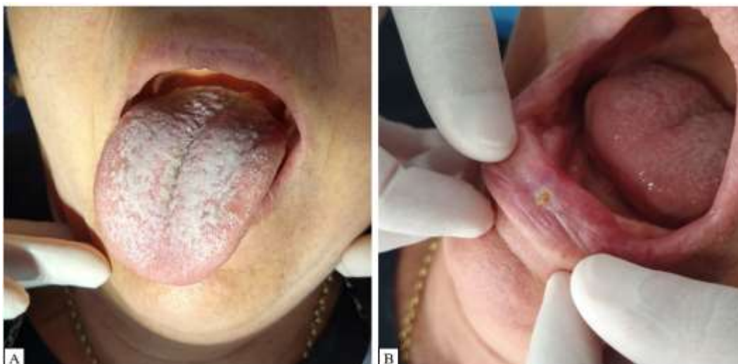
Figura 1: A - Língua com placas esbranquiçadas em toda sua extensão. B – Região de rebordo lingual eritematoso.

O diagnóstico clínico das lesões observadas em dorso de língua foi de candidíase hiperplásica. O tratamento instituído foi o bochecho de Nistatina 100.00 UI/ML, suspensão oral, utilizando 4 a 6 ml da solução por 1 minuto, 4 vezes ao dia durante 2 semanas e, após o bochecho, fazer a deglutição do medicamento.