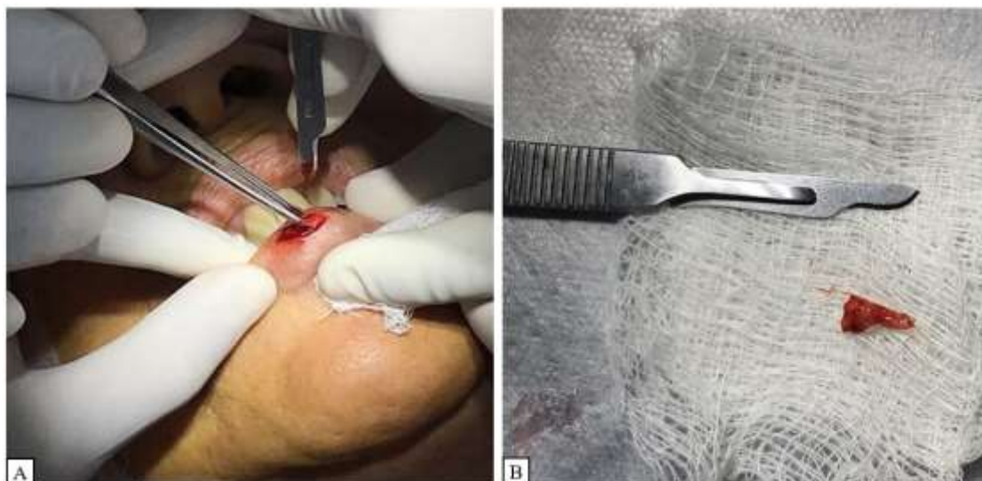
Figura 3: Incisão em lábio inferior em formato elíptico. Fragmento tecidual obtido na biópsia incisiva.

Após a remoção do fragmento, o mesmo foi manipulado com pinça Diedrich e acondicionado imediatamente em um recipiente com tamanho adequado ao tecido biopsiado contendo formol tamponado a 10% e enviado ao Laboratório de Patologia da faculdade São Leopoldo Mandic, na cidade de Campinas/SP. Como forma de reposicionar os tecidos e promover a cicatrização da região biopsiada, foi realizada sutura com 2 pontos simples, utilizando fio de nylon 5-0 (Figura 4).