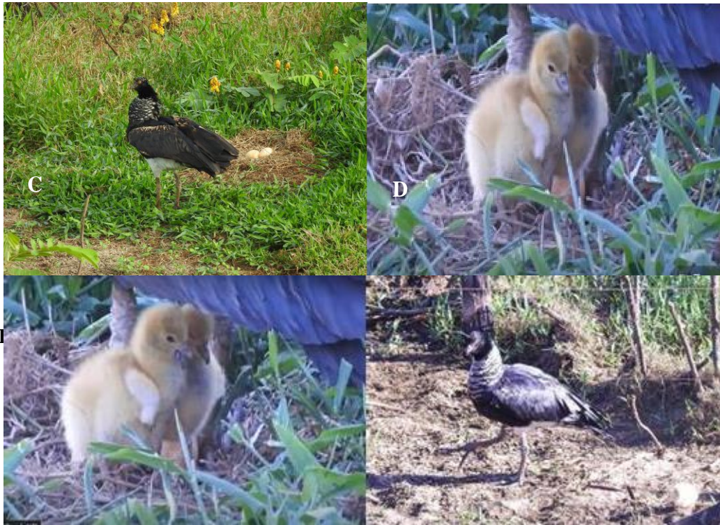
Figura 8 – Indivíduo de inhuma em posição neutra (A), filhotes de inhuma dormindo (B), filhotes de inhuma bocejando (C) e indivíduo de inhuma se locomovendo (D).