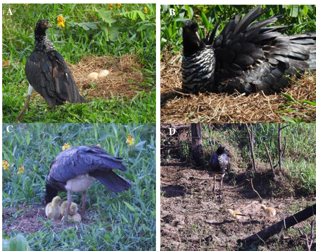
Figura 3 – Ninho de Inhuma com ovos antes da eclosão (A), após eclosão (B) e filhote após um dia da eclosão (C e D).