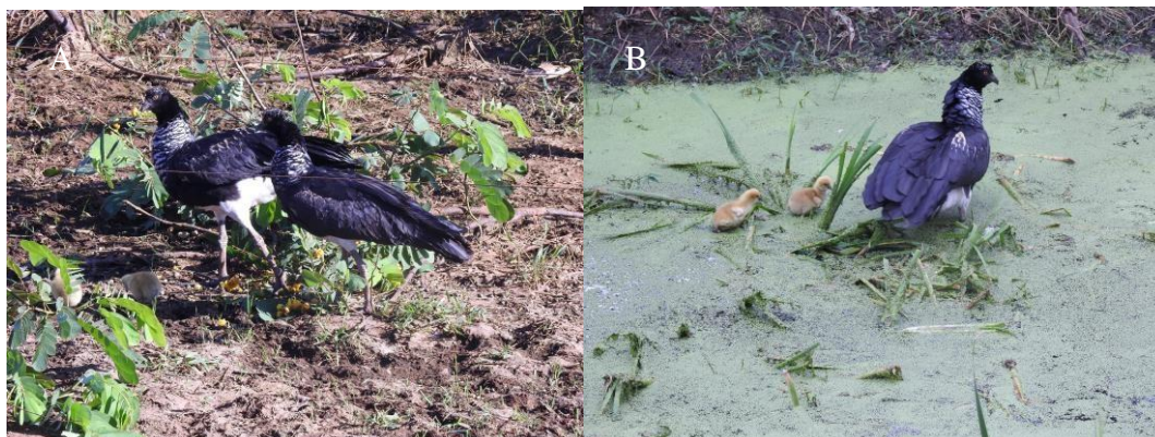
Figura 7 –Casal e filhotes de inhuma buscando alimento (A), Indivíduos de inhuma iniciando a migração do local denidificação com filhote (B).