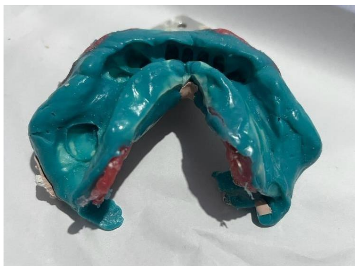
Figura 3: Moldagem da arcada inferior com silicone de condensação para confecção da prótese parcial removível.

a escolha do conector maior barra lingual, e em boca, foram realizados nichos para os grampos de apoio nos dentes pilares 34,33,43 e 38. Posteriormente, moldagem com silicone de condensação (PERFIL) na arcada inferior (Figura 3).