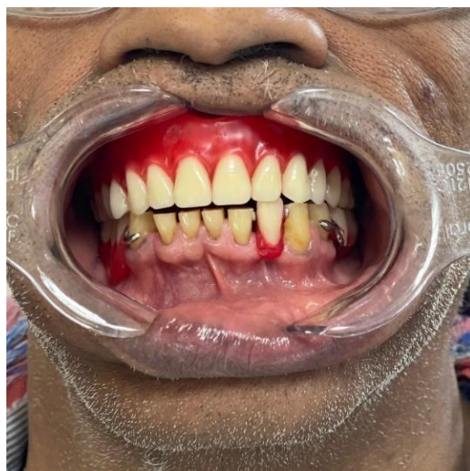
Figura 4: Prova da prótese em cera para verificar a adaptação antes da confecção final.

Ao decorrer, foram registradas as linhas dos caninos, a linha média, e linha alta do sorriso. com os modelos prontos no articulador, foi deixado um espaço de 2mm na oclusal para fazer o aumento das incisais com resina composta dos dentes que estavam desgastados.