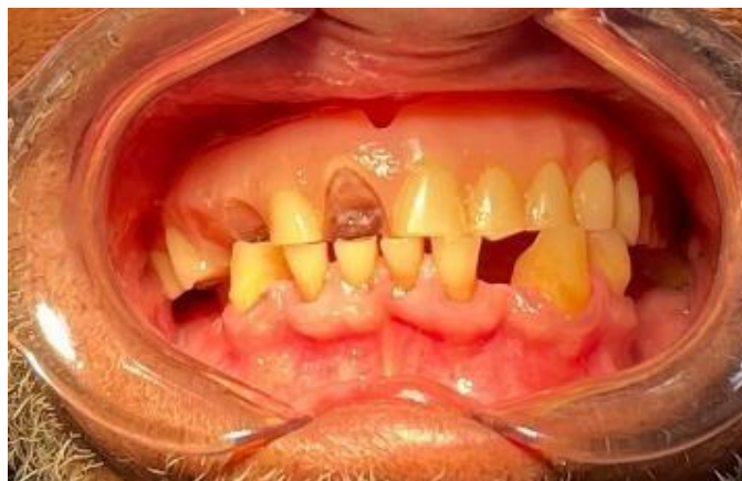
Figura 2: Aspecto clínico inicial, demonstrando desgaste dentário e presença de placa bacteriana.