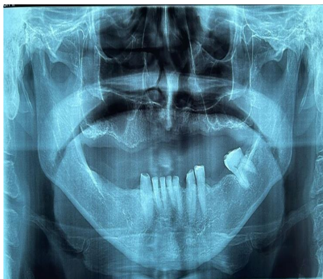
Figura 1: Radiografia panorâmica inicial do paciente, evidenciando ausência de alguns elementos dentários.

Paciente do sexo masculino, 63 anos, sem comprometimentos sistêmicos, procurou a Clínica de Odontologia da Faculdade de Ciências do Tocantins (FACIT), em Araguaína-TO, queixando-se de insatisfação estética e desconforto com sua prótese atual. Na anamnese e exame clínico (intra e extraoral), constatou-se que o paciente usava uma prótese total superior, apresentava ausência de alguns elementos dentários e desgaste nos dentes inferiores 31, 32, 33, 38, 41, 42 e 43. Esses dentes mostravam acúmulo de placa bacteriana, papilas inflamadas e ausência de mobilidade (Figuras 1 e 2).