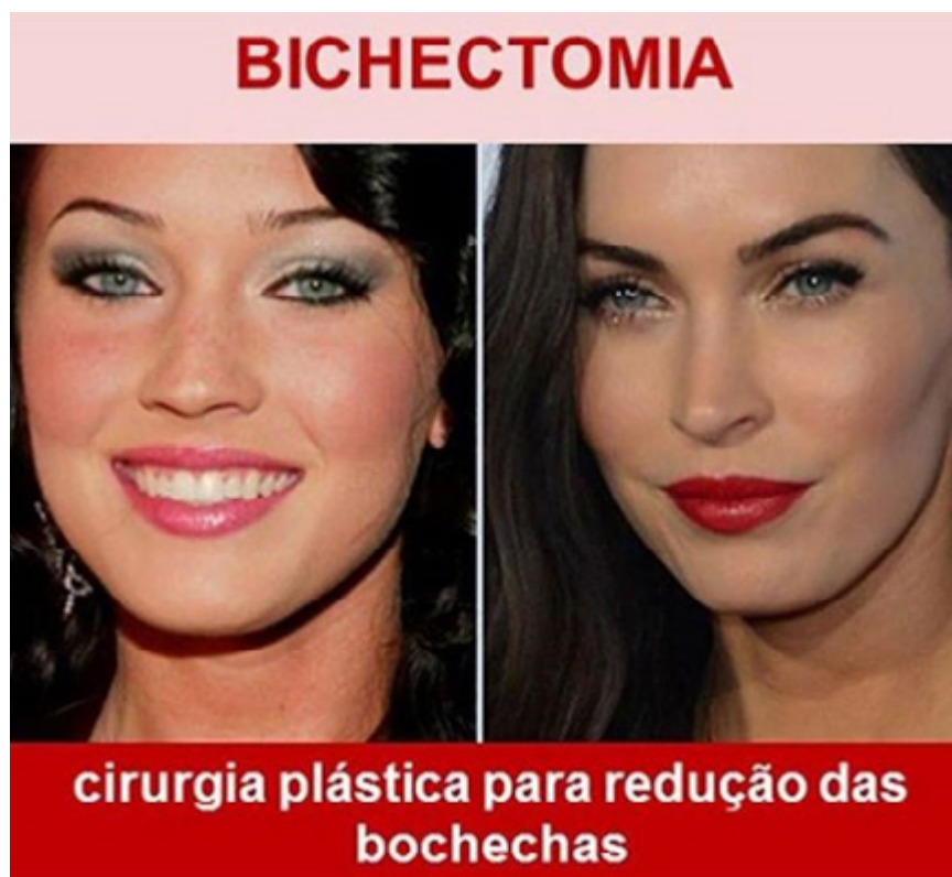
Fig. (2). Bola de Bichat: antes e depois da cirurgia.