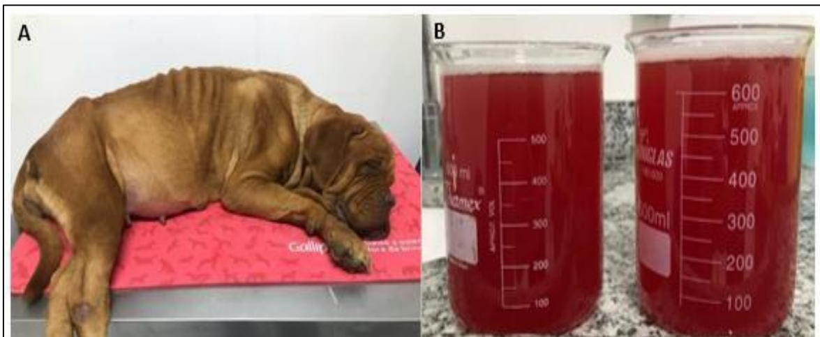
Figura 1: A) Animal durante atendimento clínico inicial apresentando caquexia, ECC=2 (escala de 1 à 9); B) Líquido ascítico drenado de característica hemorrágica.