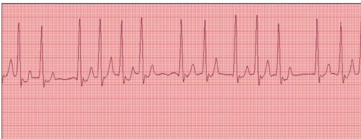
Figura 2: Traçado eletrocardiográfico com ausência de onda P (DII, 50mm/s).