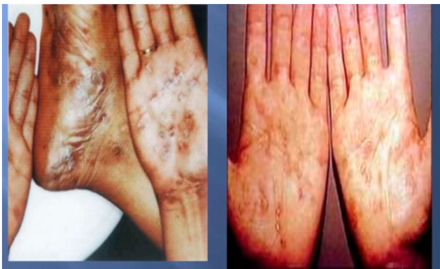
Figura 2. Sífilis secundária.