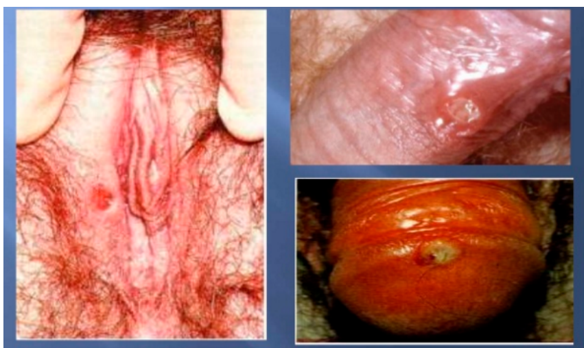
Figura 1. Sífilis primária.