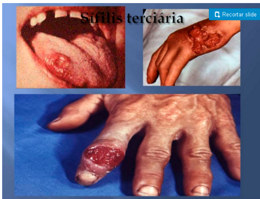
Figura 3. Sífilis Terciária.