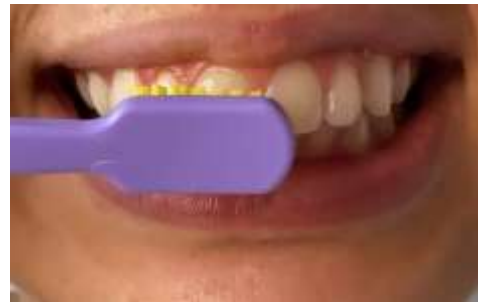
Figura 4. Escovação dos dentes de cima.

A seguir, escove as faces mastigatórias com movimentos de vai-e-vem ou de esfregação (para frente e para trás) e logo após ter certeza de ter escovado todos os dentes, enxaguar com água (Figuras 5 e 6).