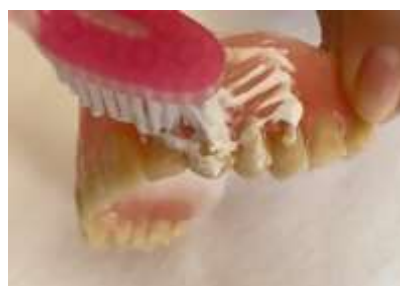
Figura 12. Creme dental to axwa kà cunea cuhhõ.