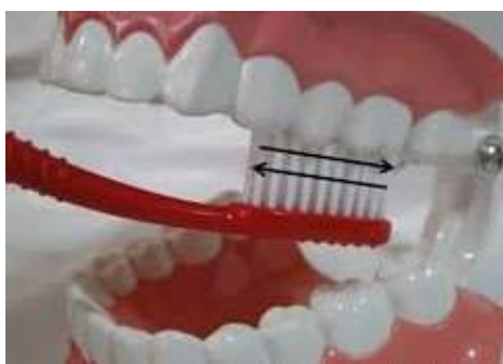
Figura 3. Técnica de Esfregar.

A Técnica de Bass é indicada para quem tem doença periodontal, pois permite limpar o sulco gengival sem agredir a gengiva e os tecidos moles. A escova é posicionada em um ângulo de 45^\circ em relação aos dentes. Quanto aos movimentos da escova, eles devem ser curtos, leves e vibratórios, mantidos por pelo menos 10 segundos em cada face dos dentes 17 .