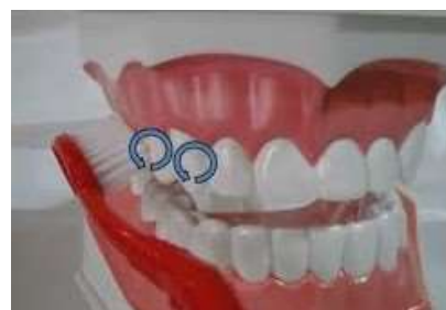
Figura 2. Técnica de Fones.