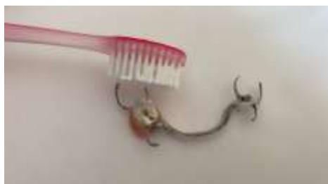
Figura 13. Próteses parcial me wa cuhhõm xà to ihcuhhõ.

2. Ne semana cunea kam axwa kà protéses cuhhõ copo nõ kãm água sanitário to cuje to pyxit,15 minuto jirôpê ca sabão neutro to ihcuhhõ quêt creme dental ne (Figura 14). Hanean semana kwyh kãm ajõ protese cakêm anõ ajõt xà wyr copo nõ kãm cô nê kãm axi (Figura 15). Ne apu água sanitária to axwa kà (protéses) nã grampo cuhhõm nõ hane quê tahnã ferruja.