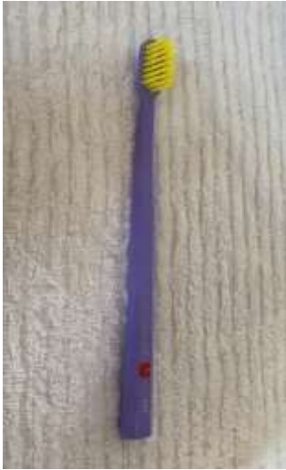
Figura 1. Ita mã imej wa cuhhõm caxuw.

1. Ca escova me wa cuhhõm xà nõ kìm caxuw, ca ihhõ rerecre në ihkrã crire në hacotre ca ihkim (Figura 1). Ne pyt wry crê jirõpê ca ajõ escova to apihpam pittì, quêrra hanean apu wa ihkêm quêt quê akac, resfriado, itajê nõ apro ca hanean to apha me pa xwa côfe cupate (Figura 2). Axwa cuhhõm jirõpê ca ampo caxwqmpê ajõ escova xà ampo côðre me bactérias cupate.