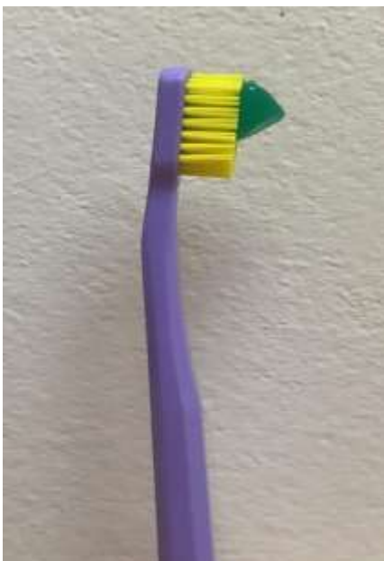
Figura 3. Creme dental nõr to me hane me ihkã mã.

2. Ca ajõ escova nã creme dental nõr to ihkryjre to hane pomquê põõhy carõt pyrac (Figura 3). Ky rumpê axwa ita ca ihkrãri ihcuhhõm to ihpro. Ne curia to hacot quêt to cajõt axwa cunea kõt to hajyr to 10 segundos, põ rumpê ne catut rumpê hanean (Figura 4).