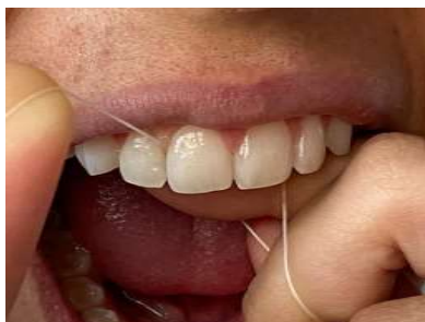
Figura 8. Fio dental sendo usado para tirar bactérias.

dentados, usar um novo pedaço de fio. Fazer isso todos os dias, de preferência à noite antes de dormir (Figura 8).