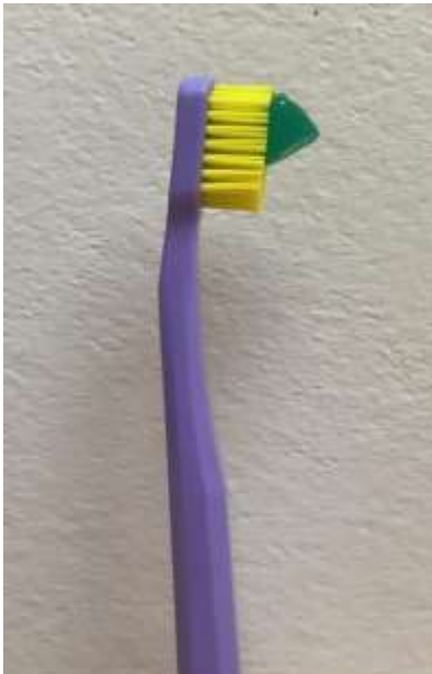
Figura 3. Quantidade de creme dental indicada para adultos.