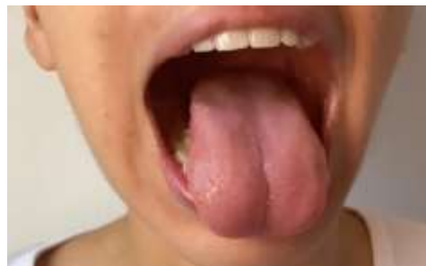
Figura 7. Língua limpa.

5. Enrolar nos dedos um pedaço médio de fio dental e passar entre todos os dentes. Passar cuidadosamente o fio entre todos os dentes, até tocar a gengiva. A cada espaço entre os