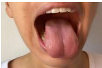
Figura 7. Hopto tetet.

4. Ne escova to ajopto cuhhõm nare me hopto cuhhõm xà to ihcuhõ, cume to pajõ jahhum ne me pa xwa cõre, me jarkwa kro cakêm caxuw (Figura 7).