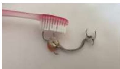
Figura 13. Escovação de prótese parcial com creme dental.