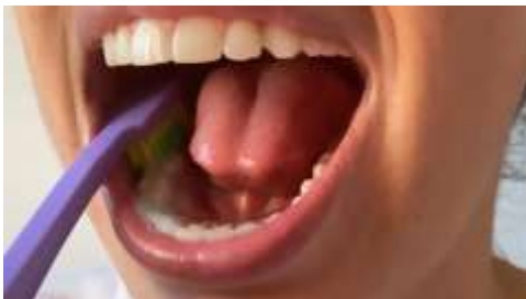
Figura 5. Escovação dos dentes de baixo.

A seguir, escove as faces mastigatórias com movimentos de vai-e-vem ou de esfregação (para frente e para trás) e logo após ter certeza de ter escovado todos os dentes, enxaguar com água (Figuras 5 e 6).