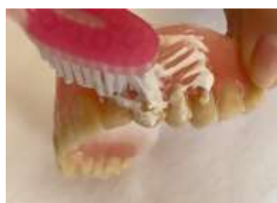
Figura 12. Escovação de prótese total com creme dental.