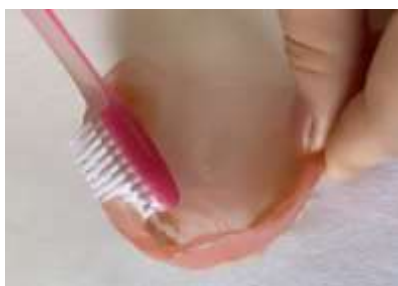
Figura 11. Creme dental to axwa kà cunea cuhhõ.