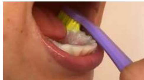
Figura 6. Escovação dos dentes de baixo.