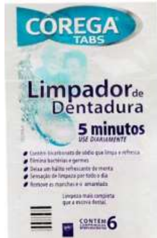
Figura 18. Me wa kà cuhhõm xà (protese).