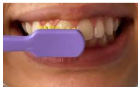
Figura 4. Kwyrumpê wa cuhhõm xà.