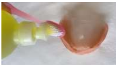
Figura 9. Sabão neutro to axwa kà cunea cuhhõm peaj to hane.

1. Protéses cuhhõm caxuw ca creme quêt dental sabão neutro kwypy, ne escova xwa rerecre nõ to ihcuhhõ ne, quê ama escova ajkrut ihnõ me wakà (protéses) caxuw quê ihnõ quê ihnõ me wa caxuw hanean (Figuras 9 a 13).