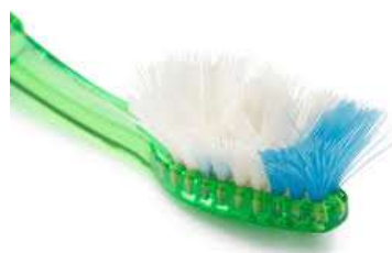
Figura 2. Escova de dentes desgastada que não pode usar.

2. A quantidade ideal de creme dental é do tamanho de um caroço de milho (Figura 3). Comece a escovação pelos dentes de cima com movimentos curtos e de bolinha em todas as partes dos dentes, por pelo menos 10 segundos, repetindo os movimentos dentro e fora também (Figura 4).