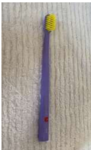
Figura 1. Modelo de escova dental ideal.

1. Ao escolher uma escova de dente, prefira as de pelinhos macios, cabeça pequena e redonda (Figura 1). É importante realizar a troca a cada 3 meses, quando os pelinhos da escova estiverem deformadas ou após gripes e resfriados, pois isso diminui as chances de uma nova infecção por bactérias nas cerdas (Figura 2). Após a escovação, a escova deverá ser guardada dentro de uma vasilha fechada, longe das bactérias e insetos.