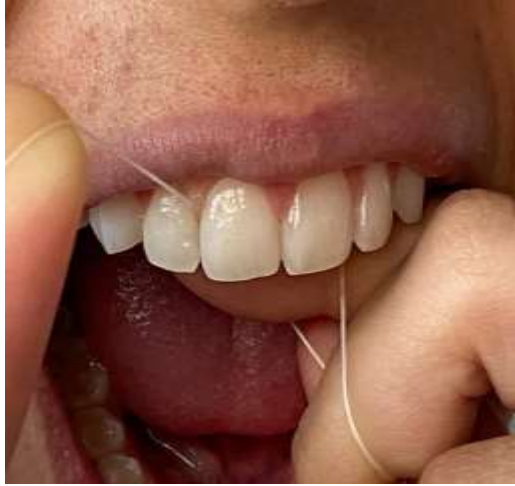
Figura 8. Wa caxumxà to axwa corê cakê.