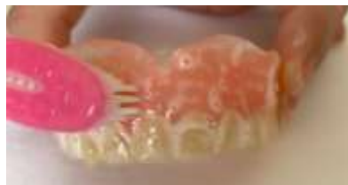
Figura 10. Sabão neutro to axwa kà cunea cuhhõ.