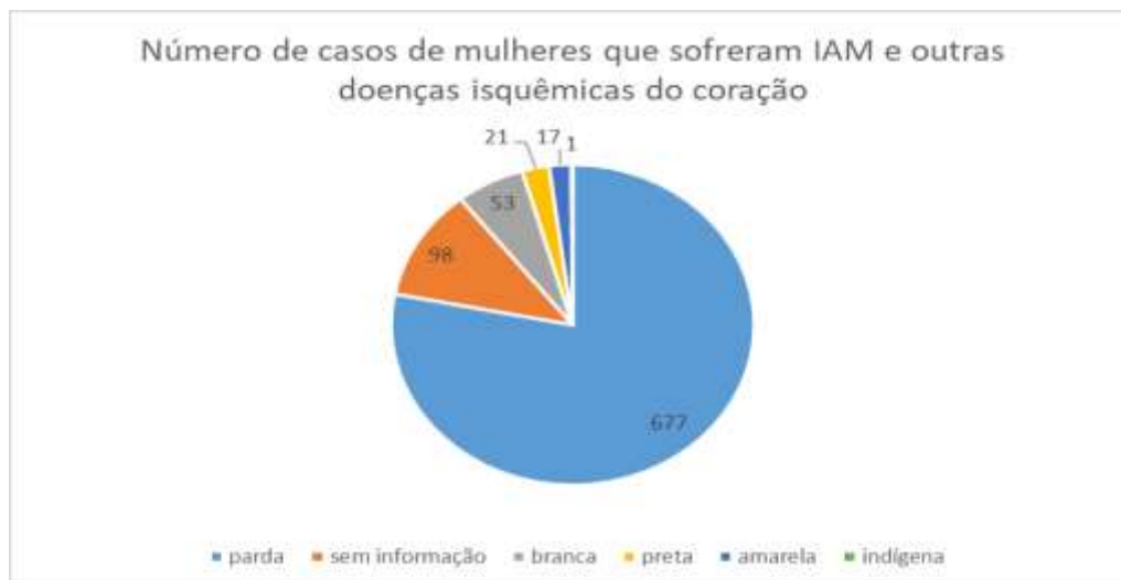
Imagem 2. Número de casos de mulheres que sofreram infarto agudo do miocárdio e outras doenças isquêmicas do coração de acordo com a cor/raça.