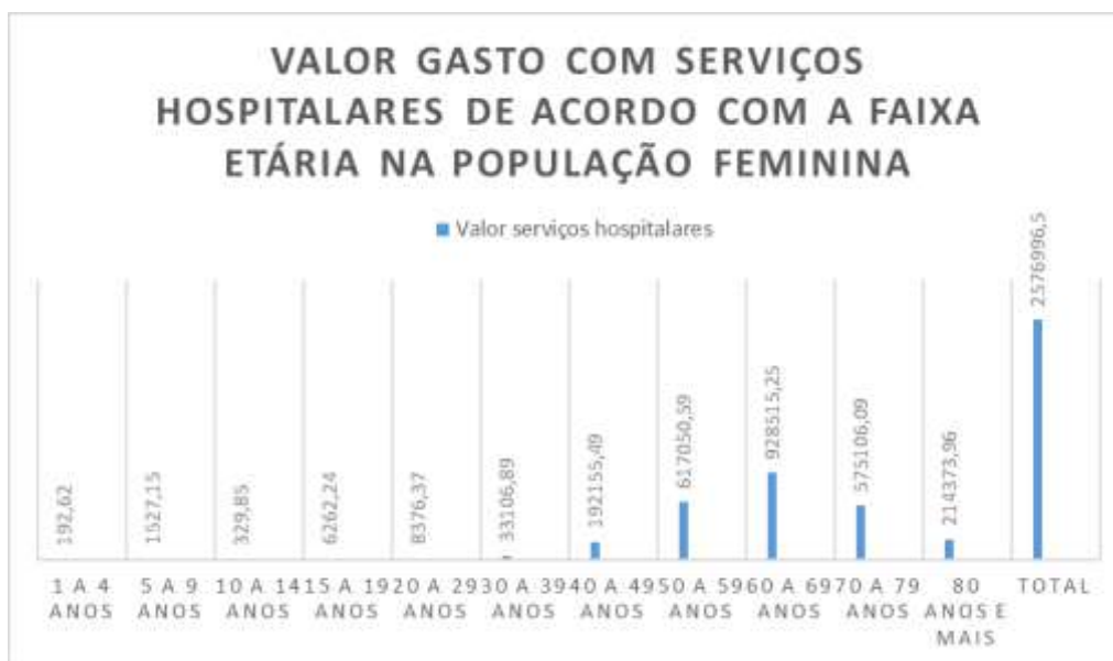
Imagem 4. Valor gasto com serviços hospitalares de acordo com a faixa etária na população feminina.

totalizaram somente R$ 225.262,39 reais, um valor aproximadamente 7 vezes menor que o gasto com o outro grupo (Imagem 4).