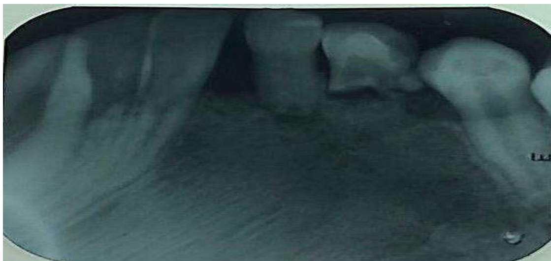
Figura 8. Radiografia periapical evidenciando neoformação óssea.

Após 11 meses a paciente retornou para o acompanhamento pós-operatório, sendo realizado exame radiográfico no qual foi confirmada a não recidiva da lesão cística, substituição do tecido lesado, neoformação de tecido ósseo na região da lesão e sem sinais flogísticos (figura 8).