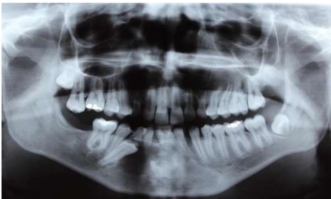
Figura 1. Radiografia panorâmica evidenciando imagem radiolúcida envolvendo a coroa dos elementos 43 e 44.