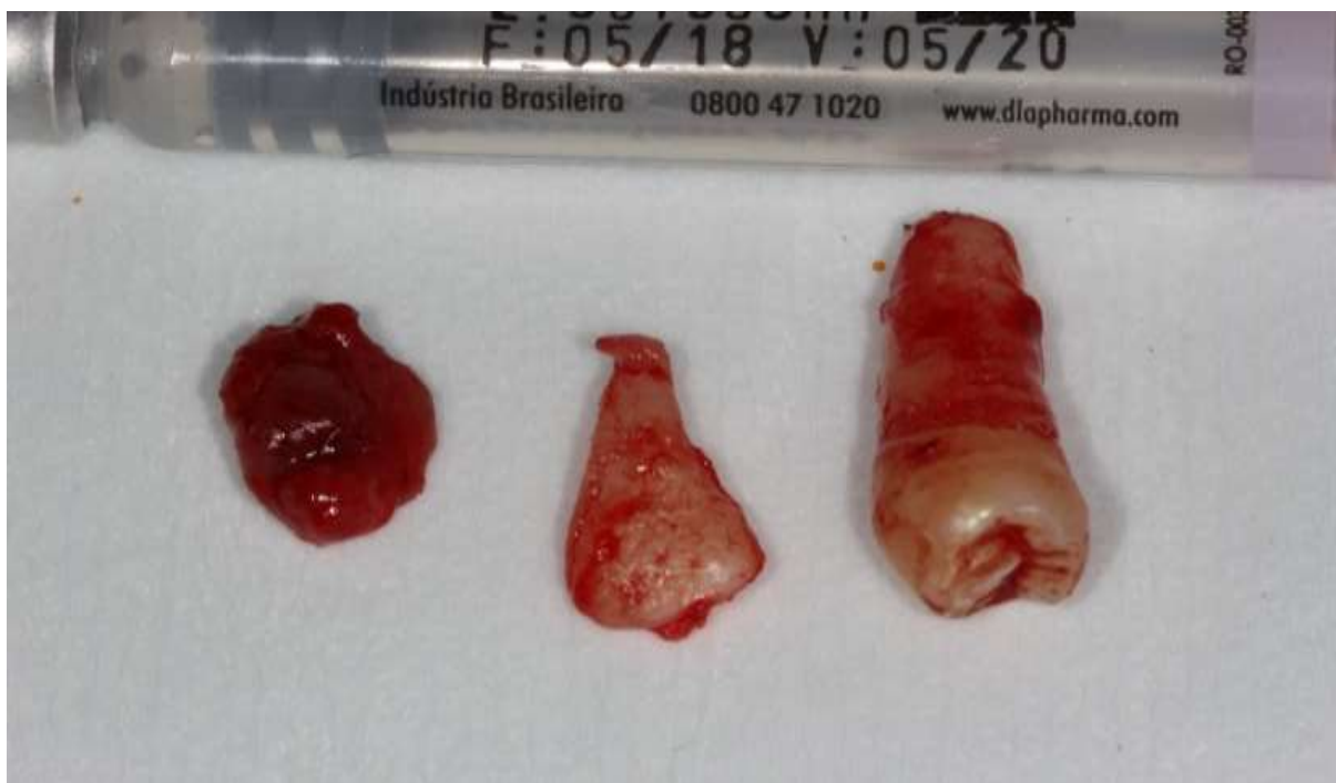
Figura 5. Cisto e elementos dentais 43 e 44.

Utilizou-se uma cureta cirúrgica com a finalidade de descolar toda a amostra tanto das dentições quanto de todo tecido ósseo circundante, garantindo assim que toda lesão fosse removida, objetivando-se evitar uma possível recidiva. Dessa forma, foi possível a visualização da coroa do elemento 44, efetuando sua exodontia com auxílio de um extrator 304, em seguida a exodontia do elemento 43 que se apresentava de forma incomum no que se refere a sua anatomia dental (figura 5).