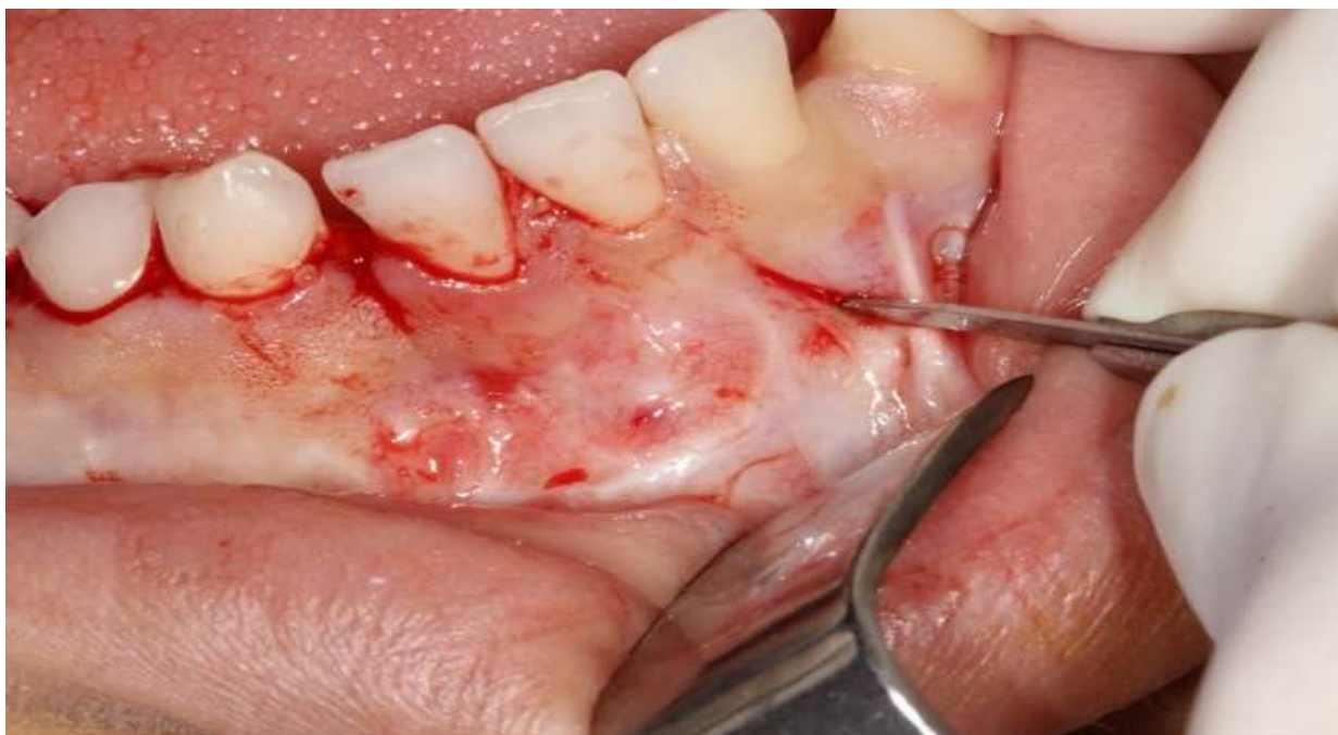
Figura 2. Retalho do tipo Neuman

Após a antisepsia extra oral com P.V.P.I tópico a 2% e intraoral com clorexidina a 0,12%, foi realizado a anestesia por bloqueio regional dos nervos mentoniano, alveolar inferior e lingual.