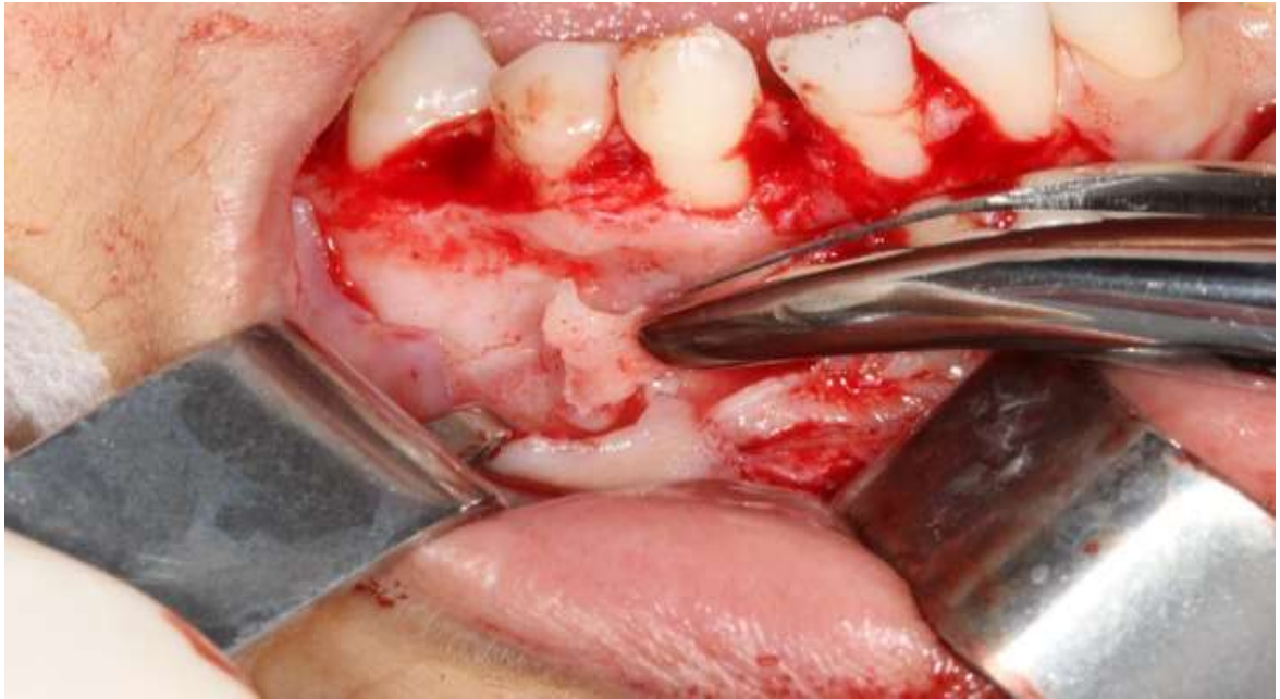
Figura 3. Ostectomia com auxílio de uma pinça goiva.