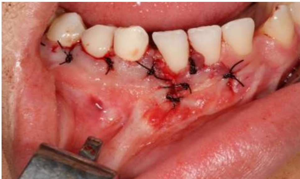
Figura 7. Sutura do retalho cirúrgico.

Em seguida, foi realizada a sutura com fio de nylon 3-0, iniciando pelo fechamento da incisão relaxante seguido por pontos simples entre todos as papilas dentais envolvidos no retalho (figura 7).