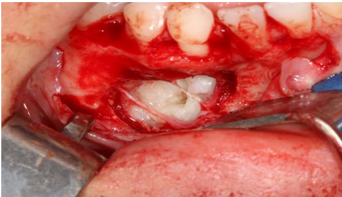
Figura 4. Cisto dentígeros