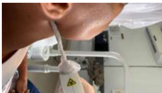
Figura 12. Drenagem linfática auricular