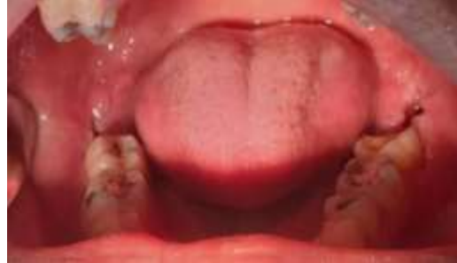
Figura 16. Remoção de sutura doze dias após a extração do elemento 38