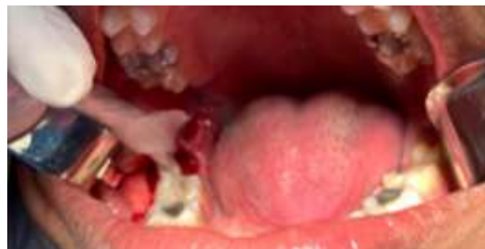
Figura 4. Aplicação do laser direto no alvéolo do elemento 48