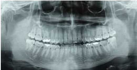
Figura 17. Radiografia panorâmica antes das extrações