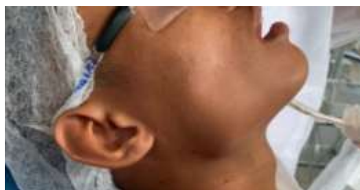
Figura 10. Drenagem linfática submentoniana