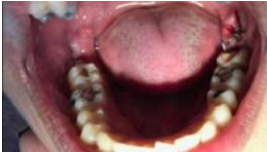
Figura 15. Doze dias após extração do elemento 48