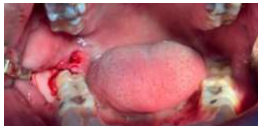
Figura 2. Osteotomia na vestibular do elemento 48