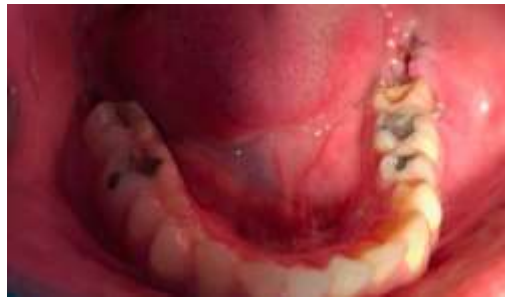
Figura 14. Sete dias após a extração do elemento 38