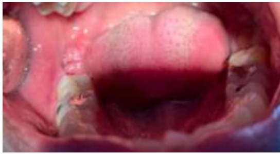
Figura 13. Remoção de sutura seis dias após a extração do elemento 48