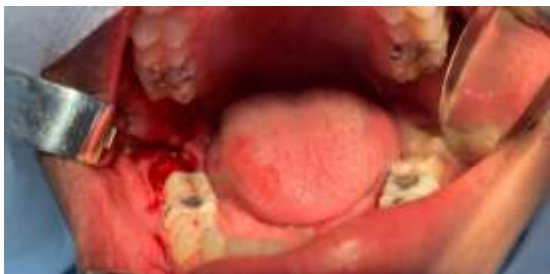
Figura 3. Alvéolo dentário após extração do elemento 48