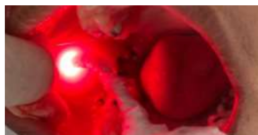
Figura 8. Aplicação do laser na região do elemento 48