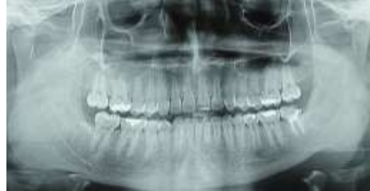
Figura 18. Radiografia panorâmica dois meses após as extrações