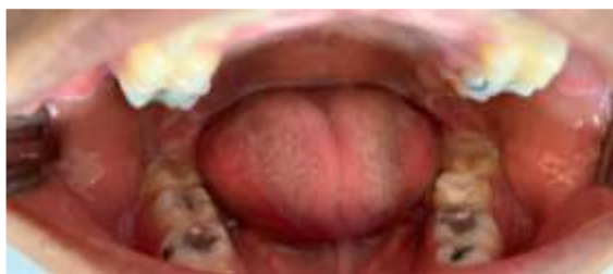
Figura 1. Elementos 38 e 48 antes da extração

Feito o acompanhamento pós-cirúrgico em ambas as extrações, observou-se o processo de reparação tecidual, a qual a região submetida a laserterapia do elemento 48, teve uma cicatrização bastante significativa em apenas seis dias após a extração, removendo então a sutura neste período (Figura 13). Enquanto, o processo de reparação tecidual da região do elemento 38, a qual, não foi submetida a laserterapia, teve um reparo tecidual mais lento (Figura 14), levando um período de doze dias para obter o mesmo resultado, removendo a sutura somente doze dias após a extração do elemento 38 (Figura 16).