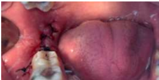
Figura 5. Sutura da região do elemento 48