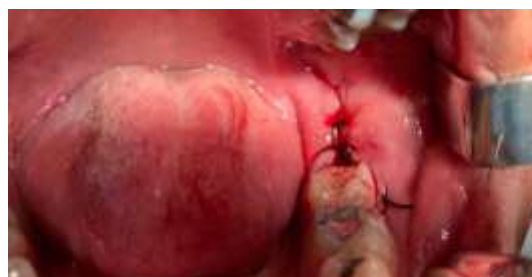
Figura 6. Sutura da região do elemento 38