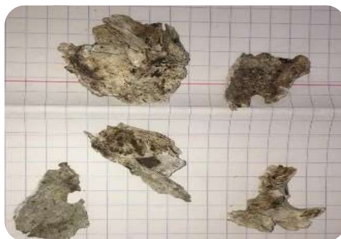
Figura 2. Restos ósseos das cabeças suínas N3, N5 e N9 após serem carbonizadas.