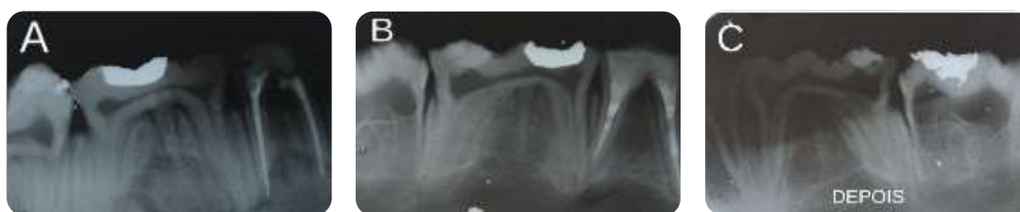
Figura 1. Radiografias das cabeças N3 (A), N5 (B) e N9 (C), mostrando os elementos dentários de suínos, antes das cabeças serem carbonizadas.

Após análise detalhada das cabeças carbonizadas N3, N5 e N9 fez-se a comparação das radiografias tiradas antes (Figura 1) e as imagens obtidas após 12 meses de análise.