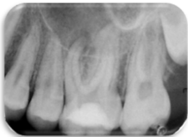
Figura 1. Radiografía periapical inicial

Paciente masculino de 13 años de edad fue derivado al consultorio con indicación para tratamiento endodóntico en el primer molar superior izquierdo. La historia clínica refiere que le habían realizado la apertura del diente en un consultorio privado sin haber ingresado a los conductos (Figura 1). El paciente no presentaba síntomas de dolor al momento de realizarle el diagnóstico.