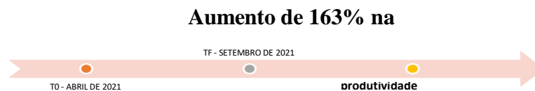
Gráfico 2: Resultado da mensuração do Indicador Inicial e Indicador Final – ( TO e TF) – Papelaria.

A empresa 02 apresentou o melhor aumento de produtividade de todas, 163% nototal, o acompanhamento gerou melhoria em todos os setores, com grande evolução em todos os índices, mesmo não atingindo o nível máximo, conseguiu evoluir em percentuais a partir de sua base, mais que todas as outras.