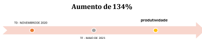
Figura 3: Resultado da mensuração TO e TF – Imobiliária

A empresa 04 obteve um aumento de 94% na produtividade, mas apresentou deficiência e regrediu no índice de práticas sustentáveis, que podem, trazer futuros prejuízos, inclusive de imagem perante seu público consumidor.