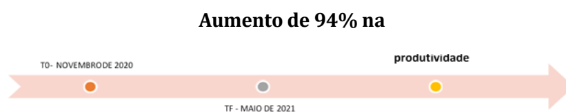
Figura 4: Resultado da mensuração TO e TF – Laboratório

A empresa 04 obteve um aumento de 94% na produtividade, mas apresentou deficiência e regrediu no índice de práticas sustentáveis, que podem, trazer futuros prejuízos, inclusive de imagem perante seu público consumidor.