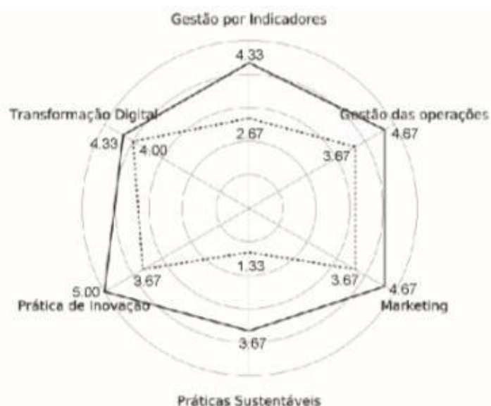
Gráfico 2: Evolução na aplicação de ideias inovadoras – Comunicação.

Em relação a empresa 01 foi realizado um levantamento para mapear a evolução da adoção de ideias inovadoras. Os resultados dessa análise são expressos no Gráfico 2: