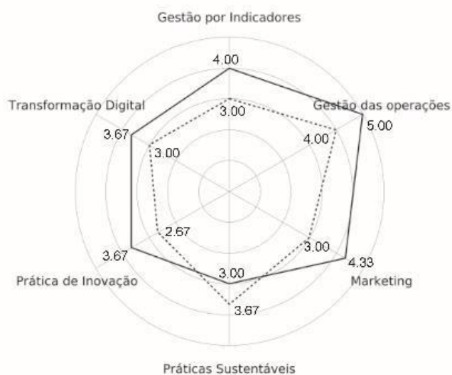
Gráfico 5: Evolução na aplicação de ideias inovadoras – Laboratório.

A empresa 04 foi a única que regrediu na dimensão práticas sustentáveis, entretanto nas outras cinco dimensões houve aumento dos índices. Os resultados dessa análise estão expressos no Gráfico 5, a seguir: