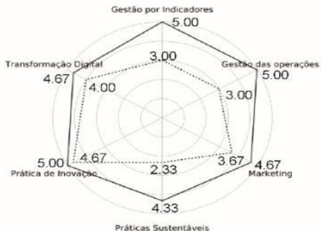
Gráfico 4 Evolução na aplicação de ideias inovadoras – Imobiliária.