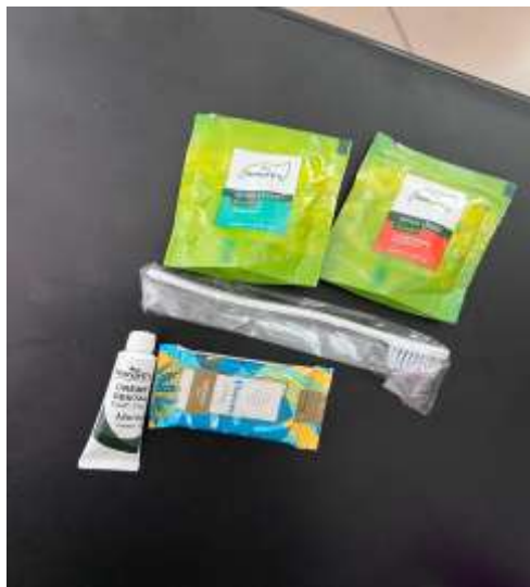
Kit higiênico oferecido a cada três dias