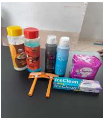
Kit higiênico oferecido mensal