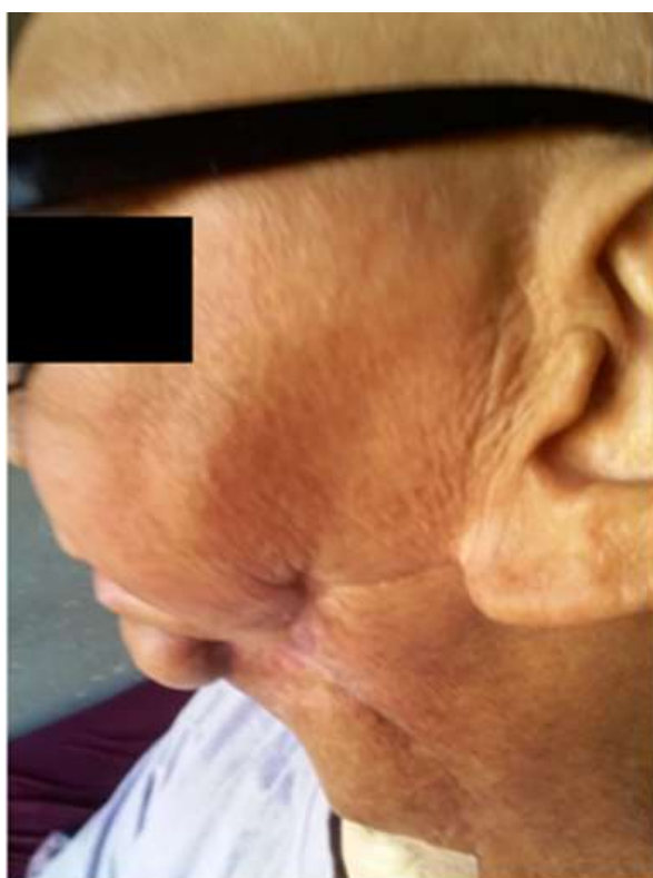
Figura 4. Fotografia do perfil evidenciando fistula cutânea decorrente de osteorradição.