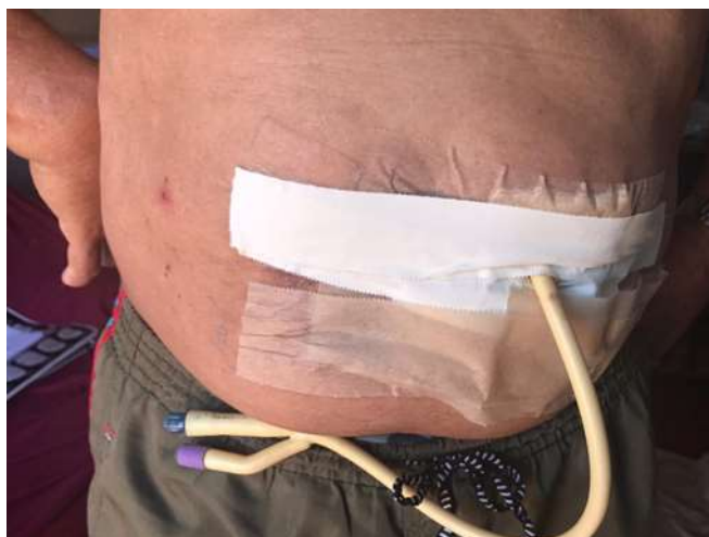
Figura 5. Sonda gástrica decorrente de complicações associadas à osteorradionecrose.